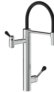
AQTiV COMBI H BWS-0024