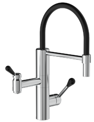
AQTiV COMBI BWS-0023